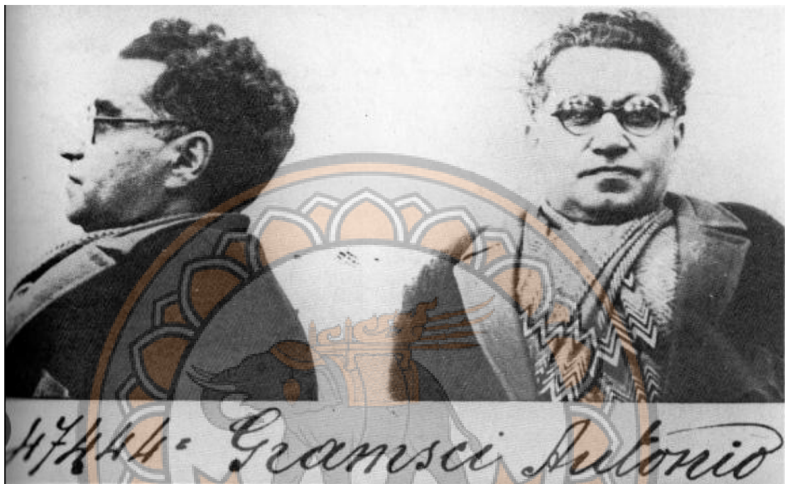
รูปภาพที่ 1 : Antonio Francesco Gramsci

ผลงานที่คาดว่าเป็นจุดเริ่มต้นของแนวคิดทางปรัชญาจากนักปรัชญาอิตาลีและอื่นๆเช่น เบนเนดีโต โกรเซ่ (Benedetto Croce) จีโวานนี เจนติเล่ (Giovanni Gentile) เกตาโน ซัลเวมินี (Gaetano Salvemini) จูเซปเป เปรซโซลินี (Giuseppe Prezzolini) รวมถึงคาร์ล มาร์กซ์ (Karl Marx )