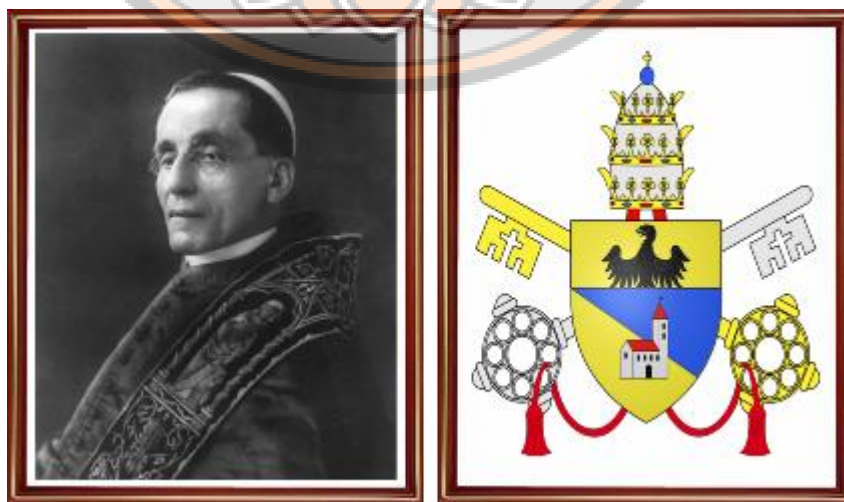
รูปภาพที่ 6 : สมเด็จพระสันตปาปาเบเนดิกต์ที่ 15 (Benedict XV)

อย่างไรก็ตามในมุมมองของผู้วิจัยซึ่งสังเกตได้จากงานเขียนของกรั่มสกีสาเหตุสำคัญประการหนึ่งที่กรั่มสกีนั้นมองว่าพรรคคอมมิวนิสต์นั้นต้องนำโดยเหล่ากรรมาชีพเท่านั้นจริงๆเพราะว่าสำหรับกรั่มสกีแล้วจากการศึกษาในเขียนของเขาใน L'Ordine Nuovo ฉบับที่ 15 และ 17 ของวันที่ 4 และ 9 กันยายน ปี 1920 พบว่ากรั่มสกีได้มองเห็นเหตุการณ์สำคัญจาก การที่พรรค Italian People's Party (ในภาษาอิตาลี: Partito Popolare Italiano, PPI ในภาษาไทย: พรรคประชาชนอิตาลี) หรือในชื่อ Italian Popular Party ซึ่งกรั่มสกีเรียกพรรคนี้สั้นๆว่า “Popular Party” สำหรับพรรคดังกล่าวเป็นพรรคที่ได้รับการสนับสนุนจากสมเด็จพระสันตปาปาเบเนดิกต์ที่ 15 (Benedict XV)