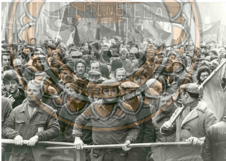
รูปภาพที่ 4 : อิตาลี 1920 ปฏิบัติการยึดโรงงาน

ทั้งสิ้น 150,000 คน แรงงานที่เข้าร่วมนั้นอาจเป็นทั้งการถูกกดขี่จากระบบราชการอิตาลีในขณะนั้น เหล่าแรงงานจึงรวมตัวกันเพื่อปกป้องผลประโยชน์ของตนเองเมื่อถึงปี.ศ. 1920 ตามรายงานเดือนกรกฎาคม 1920 ถึงคณะกรรมการบริหารคอมมิวนิสต์สากล กรัมนี่รายงานว่ามีเพียงแต่เป็นการลุกขึ้นมาต่อสู้กับชนชั้นนายทุนของชนชั้นแรงงานอิตาลีแต่ยังรวมถึงชนชั้นแรงงานยุโรปและอาจกล่าวได้ว่ารวมถึงในประวัติศาสตร์ของชนชั้นแรงงานทั่วโลกด้วย แต่ในบริบทนี้การนัดประท้วงหยุดงานครั้งใหญ่ของแรงงานในเมือง Turin ถือเป็นบทที่รุ่งโรจน์ในประวัติศาสตร์ซึ่งในเดือนเมษายนกลุ่มช่างโลหะหยุดงานเป็นเวลาหนึ่งเดือน ในขณะที่กลุ่มคนงานอื่นๆหยุดงานเป็นเวลา 10 วัน ในช่วง 10 วันสุดท้ายการประท้วงทั่วไปขยายไปทั่วเขตปิเอมอนท Piedmont โดยระดมคนงานอุตสาหกรรมและเกษตรกรรมประมาณครึ่งล้านคน ซึ่งหมายถึงการมีส่วนร่วมของประชากรราว 4 ล้านคนเพื่อเรียกร้องให้มีการควบคุมการผลิตโดยตรงจากแรงงาน ซึ่งเป็นความพยายามในการสร้างรูปแบบการปกครองของกรรมาชีพ (Proletarian Governance)