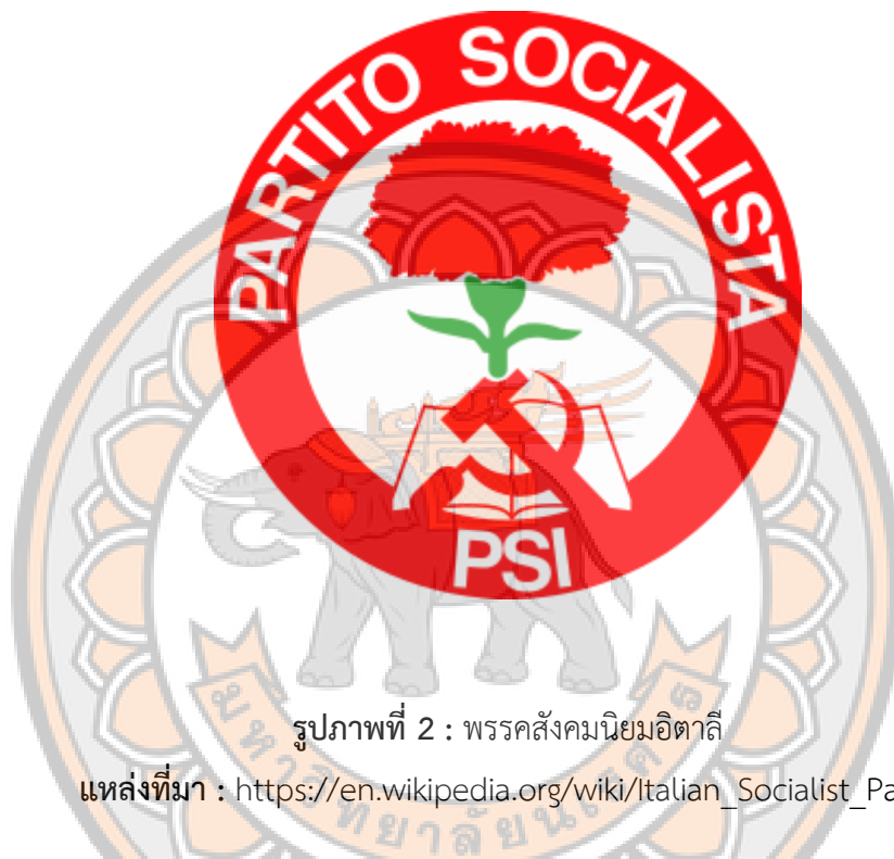
รูปภาพที่ 2 : พรรคสังคมนิยมอิตาลี

นั่นเองการปะทะกันระหว่างผู้ชุมนุมและรัฐบาลอิตาลีส่งผลให้มีผู้เสียชีวิตมากถึง 50 ราย รวมถึงการจับกุมแกนนำในการเคลื่อนไหวครั้งนี้ที่กรีมซีได้รับเลือกให้เป็นเลขาธิการของพรรคสังคมนิยมอิตาลีสายตูรินและดำรงตำแหน่งบรรณาธิการของ Il Grido del Popolo จนถึงปี 1918 (วัชรพล, 2557, น.59-61)