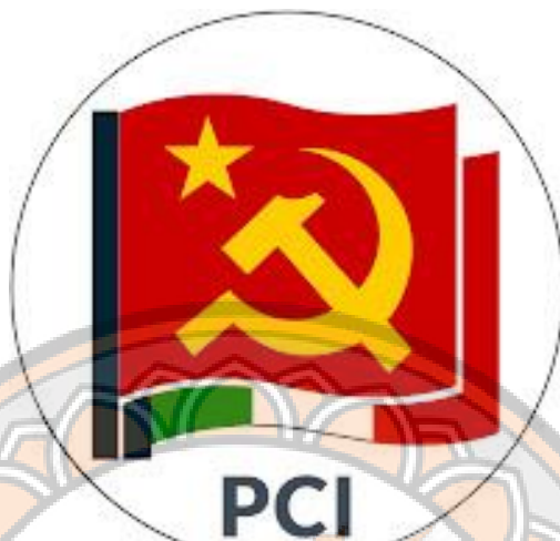
รูปภาพที่ 5 : สัญลักษณ์พรรคคอมมิวนิสต์อิตาลี

PCd'I) อย่างเป็นทางการเมื่อวันที่ 21 มกราคม ค.ศ. 1921 โดยมีเป้าหมายในการสร้างพรรคแนวลัทธิ มาร์กซิสต์-เลนินนิสต์ที่มีแนวทางปฏิรูปแตกต่างกันออกไปจากพรรคสังคมนิยมอิตาลี