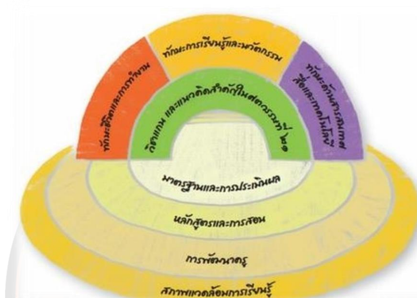
ภาพ 1 แสดงกรอบทักษะแห่งศตวรรษที่ 21

ต้องลงมือทำด้วยตนเอง เพราะฉะนั้นในการเรียนสาระวิชานี้เป็นการฝึกลงมือทำ Learning by doing and thinking เพื่อที่จะให้เกิดทักษะ 3 ด้าน คือ ทักษะชีวิตและการทำงาน ทักษะการเรียนรู้และนวัตกรรม และทักษะด้านสารสนเทศ สื่อและเทคโนโลยี