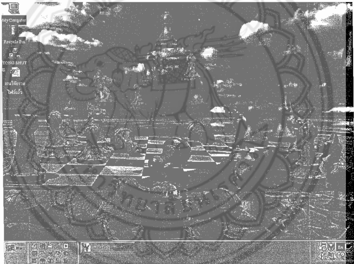
รูป 3.2 ตัวอย่างระบบปฏิบัติการ Microsoft Window98