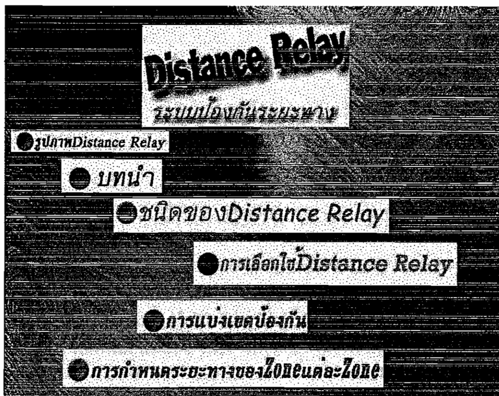
รูปที่ 4.2 ตัวอย่างหน้าต่างโปรแกรมย่อย