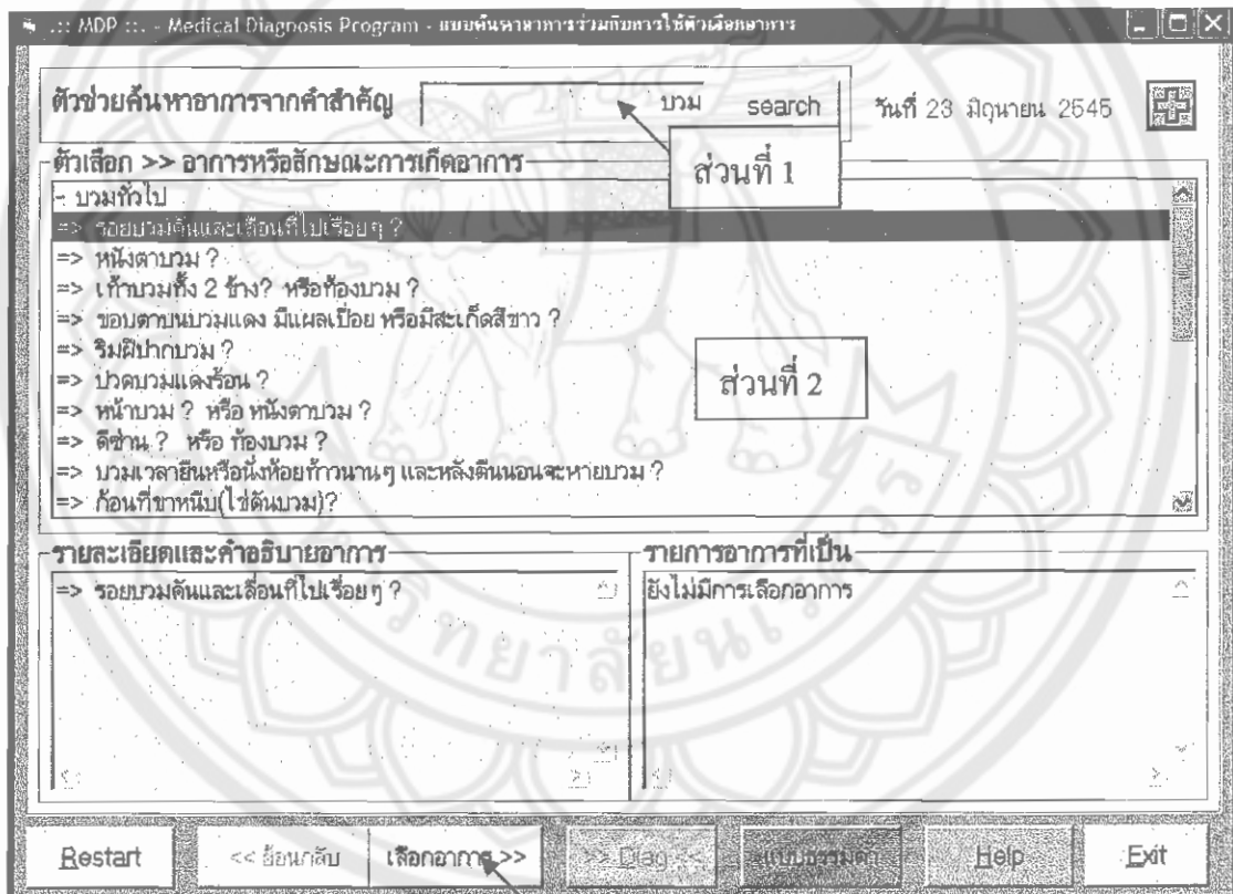
รูปที่ 4.1 แสดงการทำงานของโปรแกรม