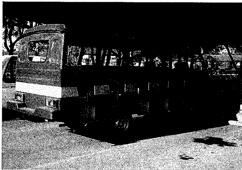
รูปที่ 3.2 แสดงจำนวนที่นั่ง 20 ที่นั่ง

จากรูปที่ 3.1 แสดงการรอรับนิสิตหน้าหอหญิง โดยรถจะเริ่มรอรับนิสิตเวลา 7.30น. จากรูปนิสิตเริ่มมาใช้บริการ โดยการให้บริการแต่ละวัน ให้บริการตั้งแต่ 7.30 น. - 17.00 น.