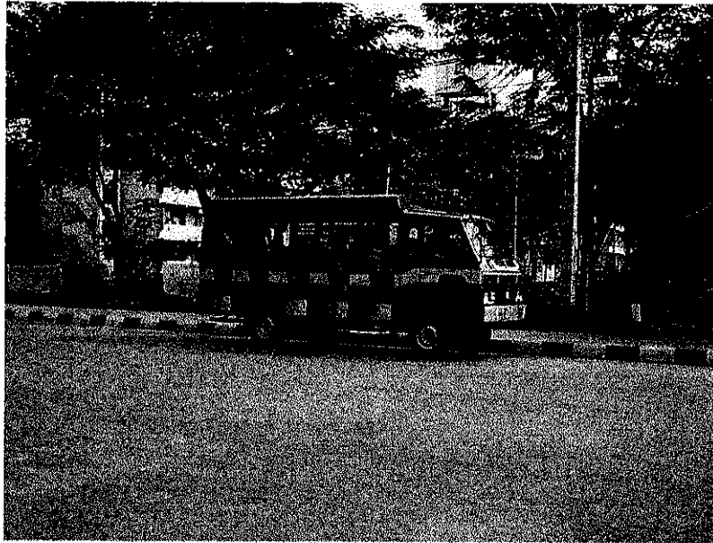
รูปที่ 3.1 แสดงจุดรับนิสิตหน้าหอหญิง

จากรูปที่ 3.1 แสดงการรอรับนิสิตหน้าหอหญิง โดยรถจะเริ่มรอรับนิสิตเวลา 7.30น. จากรูปนิสิตเริ่มมาใช้บริการ โดยการให้บริการแต่ละวัน ให้บริการตั้งแต่ 7.30 น. - 17.00 น.