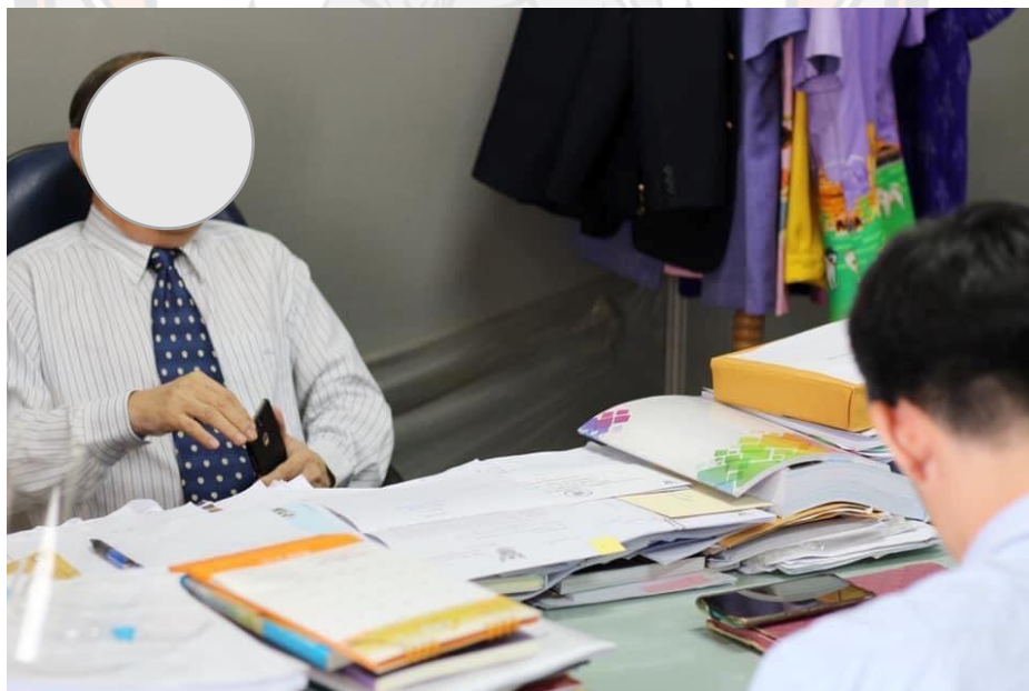
ภาพที่ 4 การลงพื้นที่เก็บข้อมูล

เจ้าหน้าที่ภาครัฐ (เทศบาลพิษณุโลก) เก็บข้อมูลโดยผู้วิจัย เมื่อวันที่ 2 ตุลาคม 2563