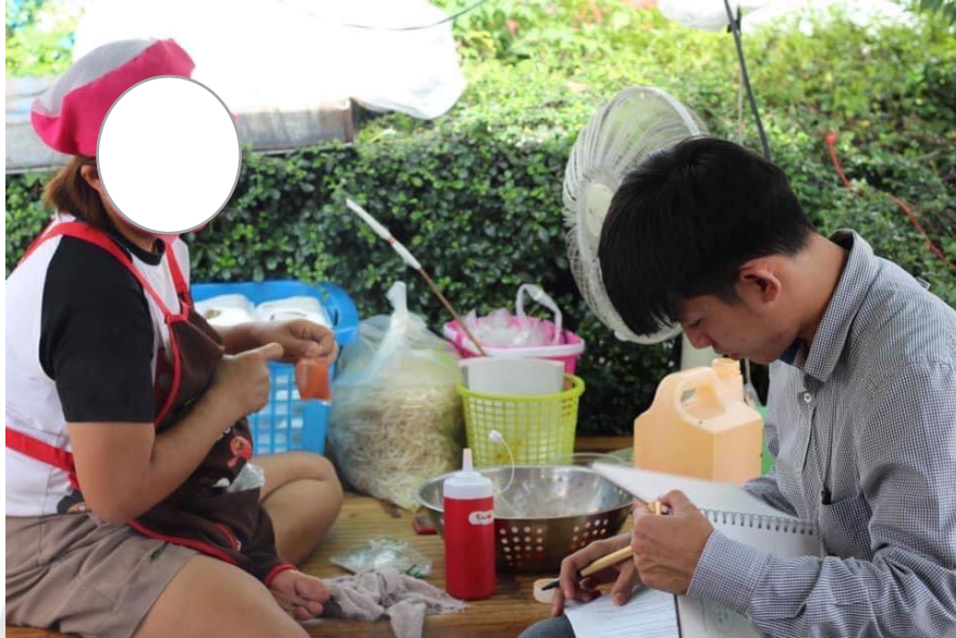
ภาพที่ 1 การลงพื้นที่เก็บข้อมูล

ผู้ค้าหาบเร่แผงลอยขายกวยเตี๋ยว เก็บข้อมูลโดยผู้วิจัย เมื่อวันที่ 30 กันยายน 2563