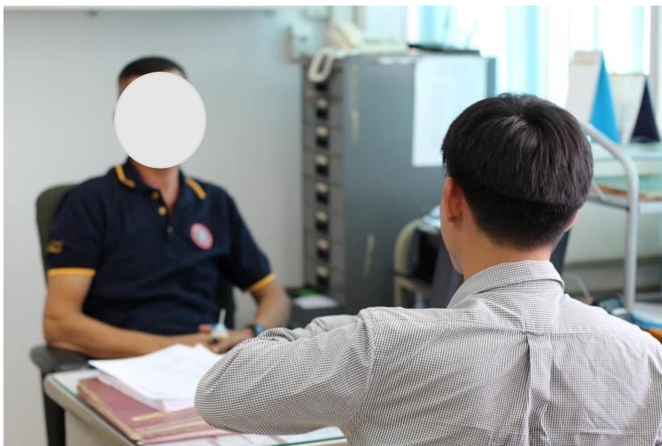
ภาพที่ 3 การลงพื้นที่เก็บข้อมูล

เจ้าหน้าที่ภาครัฐ (เทศบาลพิษณุโลก) เก็บข้อมูลโดยผู้วิจัย เมื่อวันที่ 2 ตุลาคม 2563