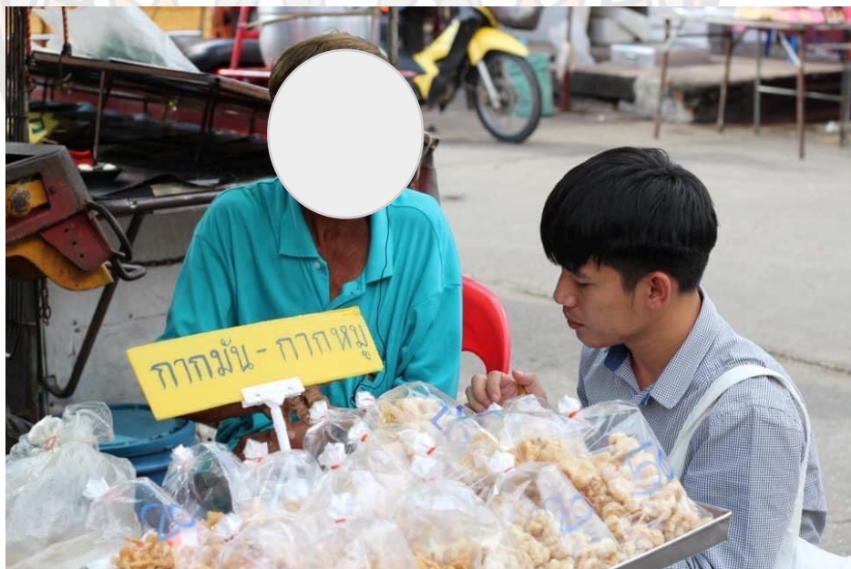
ภาพที่ 2 การลงพื้นที่เก็บข้อมูล

ผู้ค้าหาบเร่แผงลอยขายกากมัน กากหมู เก็บข้อมูลโดยผู้วิจัย เมื่อวันที่ 30 กันยายน 2563