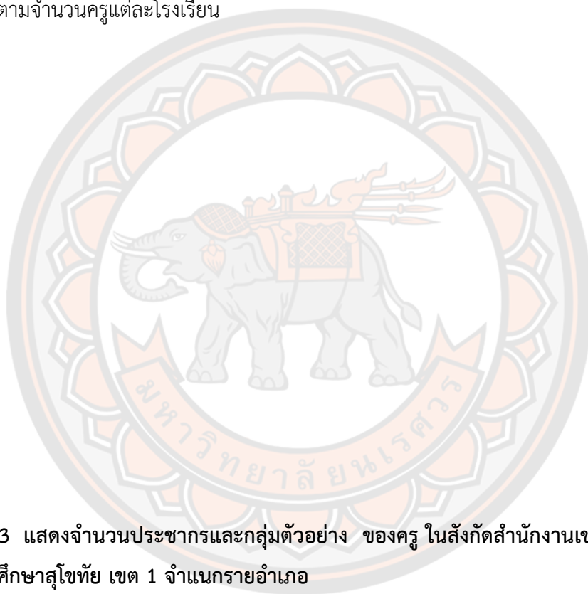
ตาราง 3 แสดงจำนวนประชากรและกลุ่มตัวอย่าง ของครู ในสังกัดสำนักงานเขตพื้นที่การศึกษาประถมศึกษาสุโขทัย เขต 1 จำแนกรายอำเภอ

1.2 กลุ่มตัวอย่าง กลุ่มตัวอย่างที่ใช้ในการวิจัยครั้งนี้ ได้แก่ ครูผู้สอนในโรงเรียนสังกัดสำนักงานเขตพื้นที่การศึกษาประถมศึกษาสุโขทัย เขต 1 ปีการศึกษา 2564 จำนวน 285 คน กำหนดขนาดกลุ่มตัวอย่างโดยการเปิดตารางของเครซีและมอร์แกน (Krejcie & Morgan อ้างถึงใน สติรพร เชาว์นชัย, 2561, น. 62) โดยการสุ่มแบบแบ่งชั้น (stratified random sampling) และกำหนดสัดส่วนตามจำนวนครูแต่ละโรงเรียน