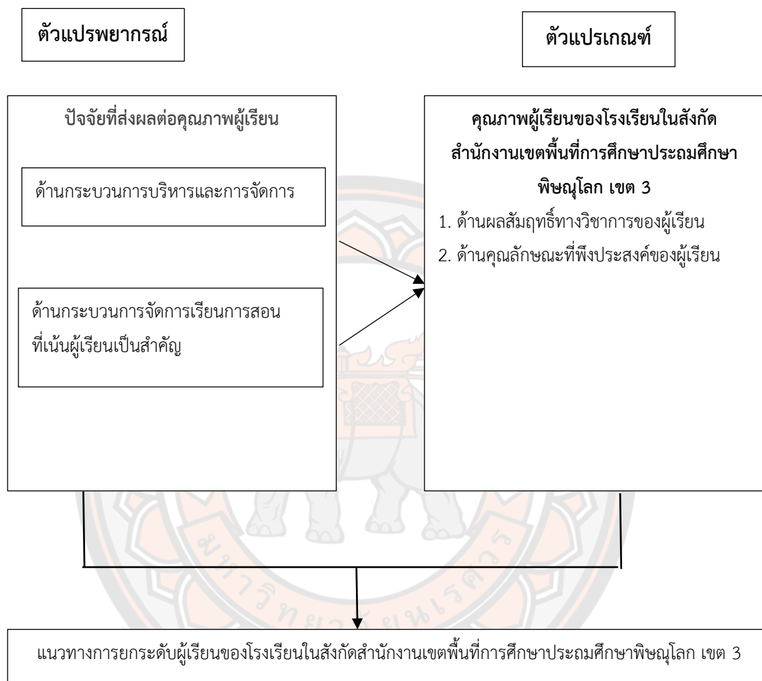
ภาพ 2 กรอบแนวคิดการวิจัย