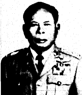
พันตำรวจโทชน อินทนา