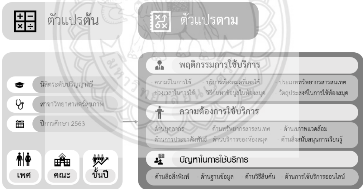
รูปที่ 1 กรอบแนวคิดการวิจัย