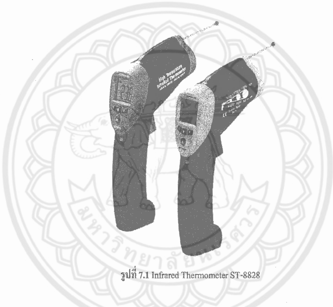
รูปที่ 7.1 Infrared Thermometer ST-8828

เครื่องวัดอุณหภูมิ Infrared Thermometer ST-8828