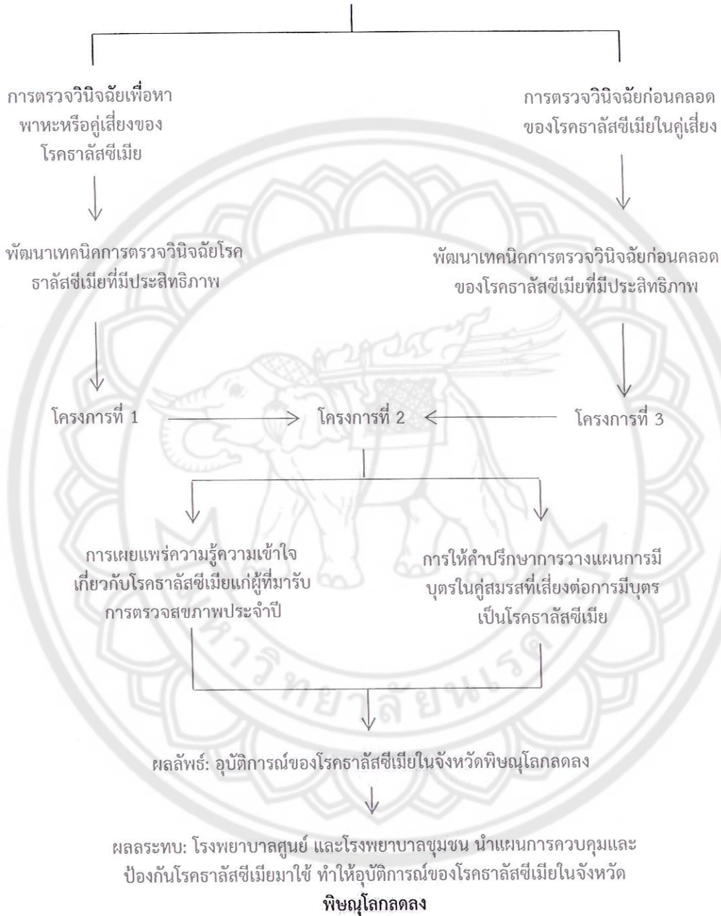
รูปที่ 1 กรอบแนวความคิดของแผนงานวิจัยโดยภาพรวม และความเชื่อมโยงของโครงการย่อย