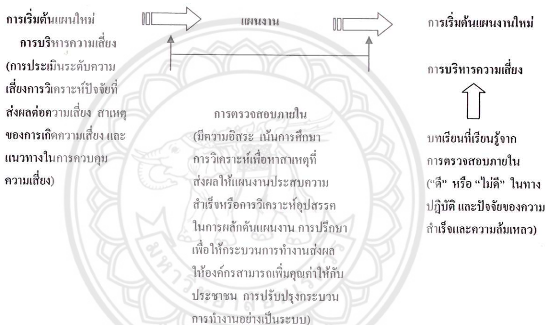
ภาพ 2 ความเชื่อมโยงระหว่างการบริหารความเสี่ยงกับการตรวจสอบภายในเพื่อให้เกิดองค์ความรู้ในองค์กร

ประเมินผล บทเรียนต่าง ๆ รวมถึงศึกษาและสรุปปัจจัยที่ส่งผลสำเร็จต่องาน โดยเฉพาะอย่างยิ่งในกรณีที่มีการให้ระดับความเสี่ยงสูงให้เสร็จภายในเงื่อนไขด้วยเวลา งบประมาณและบรรลุเป้าหมาย และผลคาดหวัง ซึ่งแผนงานที่มีลักษณะนี้แล้วเสร็จฝ่ายตรวจสอบภายในควรจะศึกษาหาปัจจัยร่วมที่ส่งผลสำเร็จของแผนงาน (Common Success Factors) หรือวิเคราะห์และจัดทำเอกสารที่เกี่ยวข้องกับวิธีการดำเนินงานที่เป็นเลิศ (Best-practice) โดยนำสิ่งที่ค้นพบมาเผยแพร่และสื่อสารภายในองค์กร ซึ่งสิ่งเหล่านี้สะท้อนถึงกลไกที่ทำให้เกิดการเรียนรู้ขององค์กรอย่างต่อเนื่อง และความพยายามผลักดันให้องค์กรมีผลการดำเนินงานที่เป็นเลิศในที่สุด