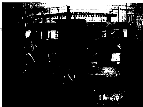
ภาพด้านบน